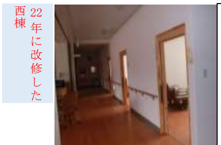
西棟 22年に改修した