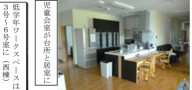
児童会室が台所と居室に