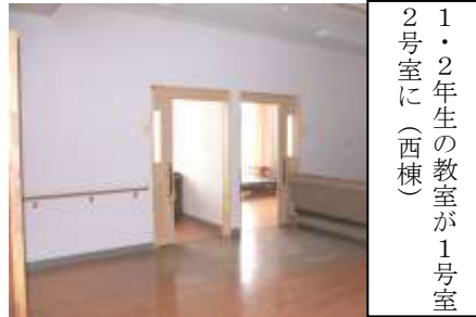
1・2年生の教室が1号室 2号室に（西棟）

旧中川小学校は地域の皆さんの思いが、いっぱい詰まっています。この歴史ある小学校のイメージをそのままにして、学校の内部は、介護サービス施設として、スプリンクラーや自動火災通報装置など安全と安心を確保しながら、家庭の雰囲気大切にできるように改修しました。