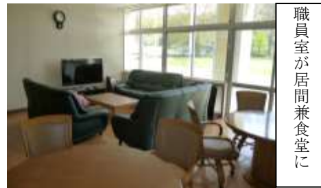
職員室が居間兼食堂に