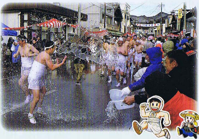
裸のだいちゃん 加勢人かつちゃん